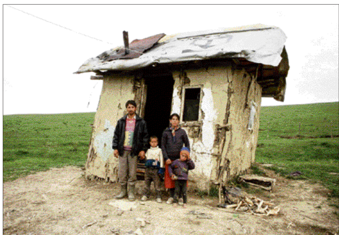
in Hetea, Roemenië leven de Roma onder erbarmelijke omstandigheden.

Boek: Blijven Lachen . Auteur: diversen. Uitgeverij: Thomas Rap. Prijs: €10 (158 blz.)