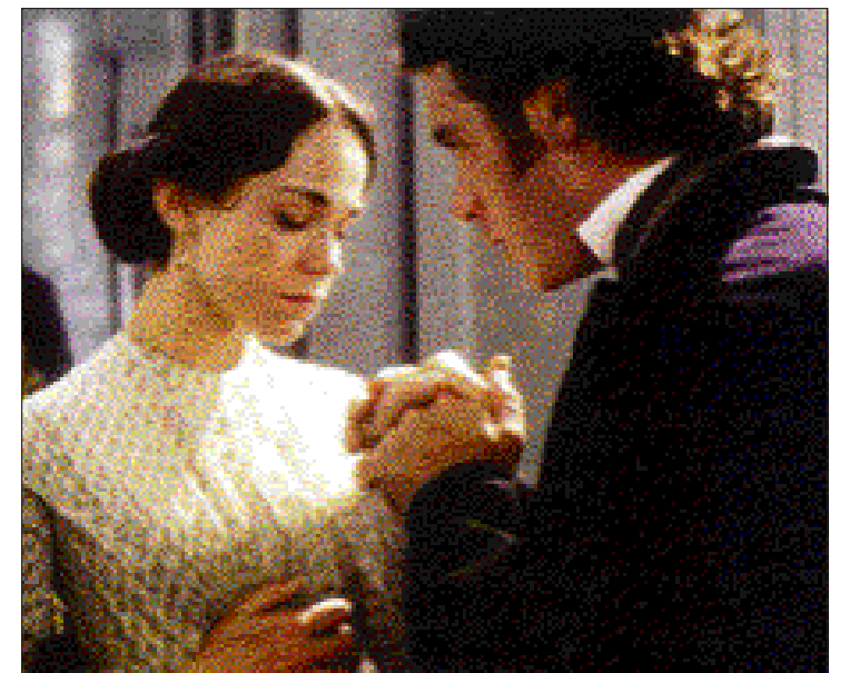
Frances O'Connor als Emma Bovary in de gelijknamige BBC-productie uit 2000, een van de beste van tien bestaande filmversies van de roman, op een dubbel-dvd verkrijgbaar.