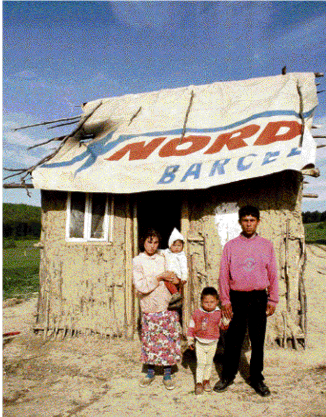
Roma-gezin in Hetea, Roemenië.